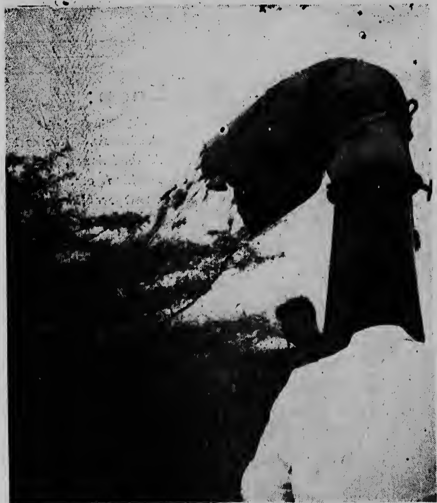
Als door een grote sturf blaast de ensileermachine de maaisstengels in gemaakte toestand de silo in. (Foto Bonke-Cliché Fuhring).

Met gevoelens van hoogachting, Dionisio Wever en 27 anderen.